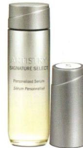
123758 Artistry Signature Select™ Anti-Flecken Kit