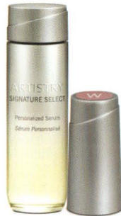
123756 Artistry Signature Select™ Anti-Falten Kit