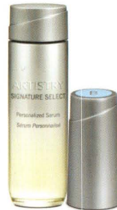
123755 Artistry Signature Select™ Aufhellendes Kit