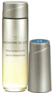
123754 Artistry Signature Select™ Hydrations Kit

Wählen Sie anhand des wichtigsten Bedürfnisses Ihrer Haut Ihr Start-Set, das aus dem Basis-Serum und einem der fünf hochkonzentrierten Verstärker besteht: Feuchtigkeitversorgung, Anti-Falten, Aufhellung, Anti-Pigmentflecken oder Straffung.