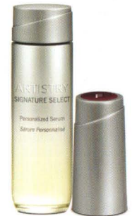
123757 Artistry Signature Select™ Straffendes Kit